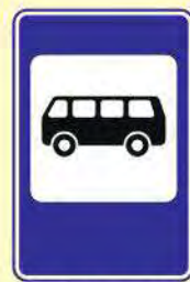
Место остановки автобуса и (или) троллейбуса

ПРАВИЛА ДОРОЖНОГО ДВИЖЕНИЯ ОДИНАКОВЫ ДЛЯ ВСЕХ – ВЗРОСЛЫХ И ДЕТЕЙ!