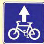
Полоса для велосипедистов