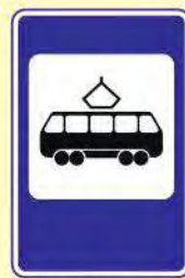
Место остановки трамвая