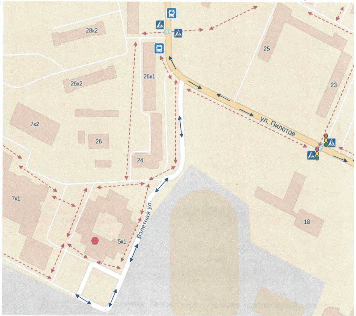
Схема организации дорожного движения в непосредственной близости от образовательного учреждения с размещением соответствующих

← - - - - - → Направление движения детей